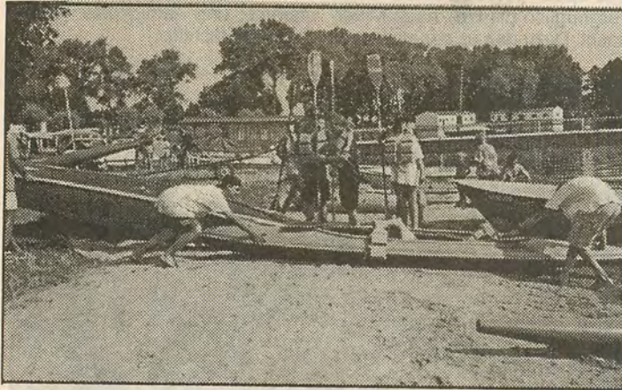
Paddeltouren stehen auch wieder auf dem Programm der Jugendbegegnung in Kalisz Pomorski

te Ausflüge nach Kolberg, Danzig und zu einer Wanderdüne geplant. Ein Teil des Aufenthaltes wird zusammen mit polnischen Jugendlichen im Zeltlager „Gudowo Relax“ verbracht. Gemeinsame Abende am Lagerfeuer, eine Lagerolympiade und ausgiebige Paddeltouren unter Anleitung der langjährig tätigen Betreuer runden das Programm ab. Weitere Fragen werden auf einem Informationsabend beantwortet, zu dem die Teilnehmerinnen und Teilnehmer noch eingeladen werden. Anmeldungen und Auskünfte unter 04191 / 72914.